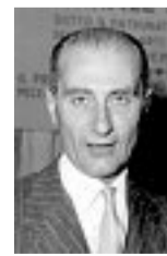
Indro Montanelli era nato a Fucecchio (Firenze) il 22 aprile 1909. È morto a Milano il 22 luglio 2001

Sarà il 25 aprile a segnare la nuova tappa nella ripubblicazione della Storia d'Italia montanelliana, un'opera attraverso la quale intere generazioni si sono appassionate alle vicende passate e hanno cominciato a conoscerle e impararle